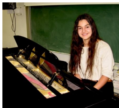
Klavierbeitrag, schulinterne Veranstaltung