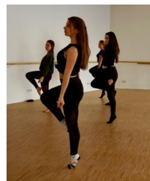
Tanzchoreografie im Studio