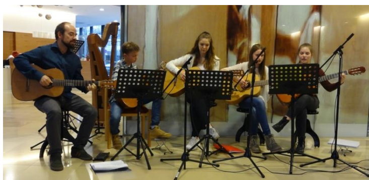
Adventliches Singen und Musizieren im Heim St. Vinzenz