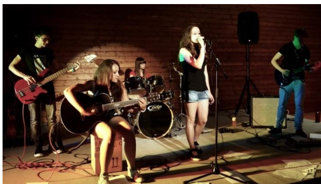
Auftritt der Rockband beim ART Event in der Kulturbäckerei