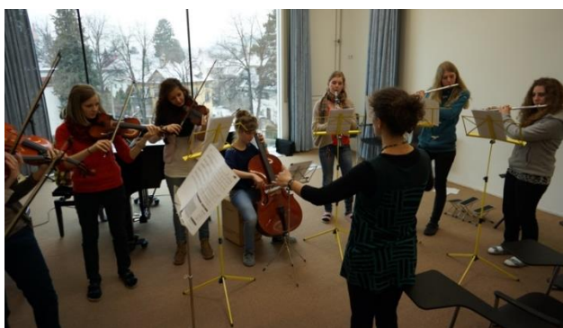
Ensemblespiel beim Vortragsabend im Musiksaal

Im Kleingruppen-Unterricht werden instrumentale/tänzerische/vokale Fertigkeiten erworben, die regelmäßig bei Aufführungen präsentiert werden können. Im jährlichen Schulablauf finden sich größere und kleinere Plattformen für musikalische Auftritte – von der Gestaltung einer adventlichen Rorate-Feier im engen Rahmen bis zum Showact beim ART-EVENT in der Kulturbäckerei im großen Stil.